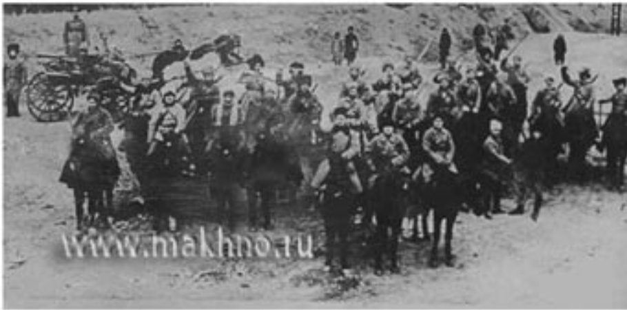
Jeden z pododdziałów machnowskich