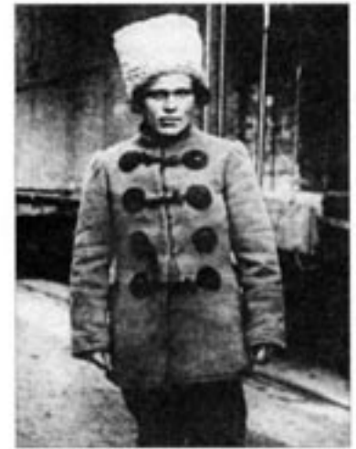
II. Nestor Machno